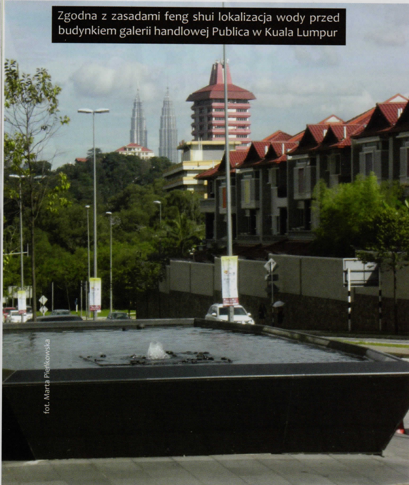
Zgodna z zasadami feng shui lokalizacja wody przed budynkiem galerii handlowej Publica w Kuala Lumpur

Na terenach pozbawionych gór należy uwzględnić inne naturalne wzniesienia, np. moreny polodowcowe, które również mają potencjał do wykorzystania. W obszarach ni-