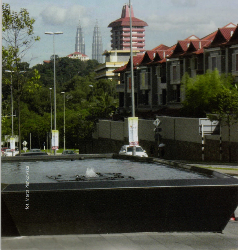
Zgodna z zasadami feng shui lokalizacja wody przed budynkiem galerii handlowej Publica w Kuala Lumpur