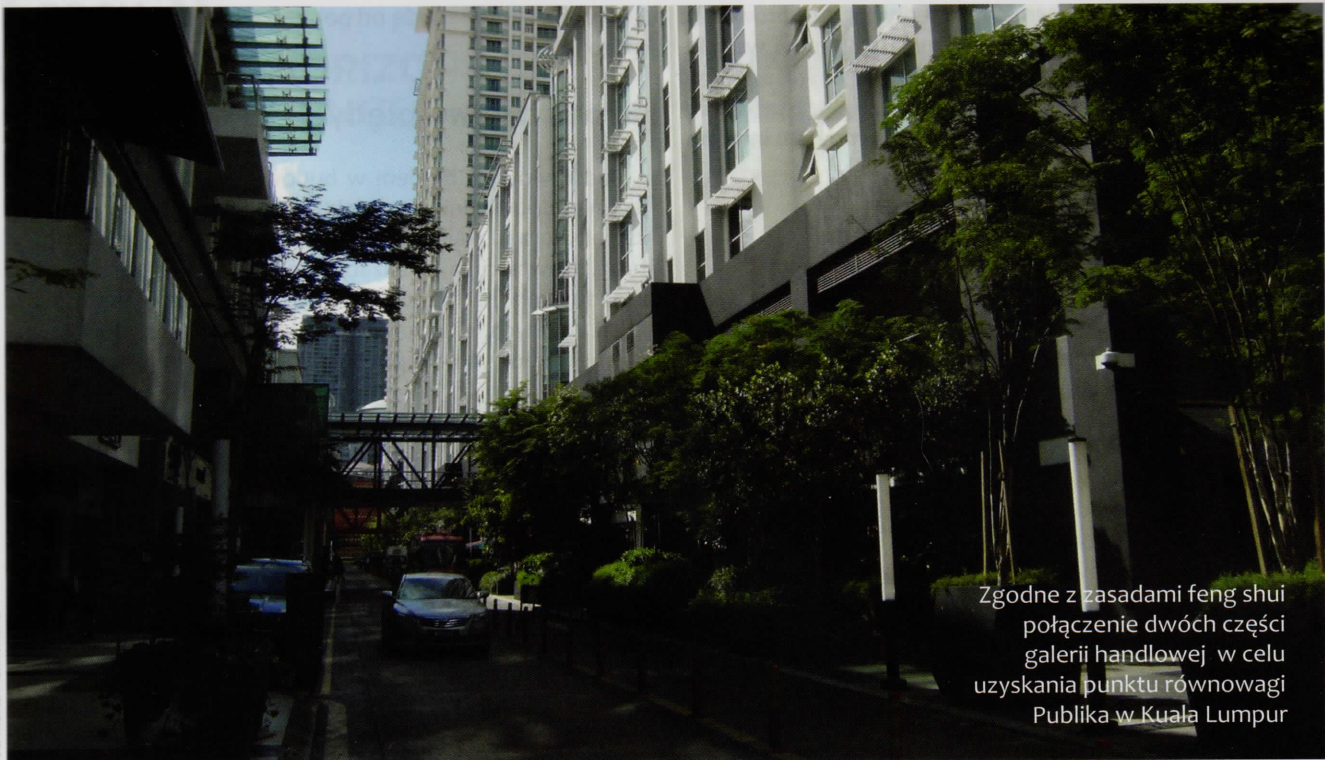
Zgodnie z zasadami feng shui połączenie dwóch części galerii handlowej w celu uzyskania punktu równowagi Publika w Kuala Lumpur

zinnych bierze się pod uwagę przede wszystkim naturalne wody powierzchniowe. Na podstawie biegu rzeki przyjmuje się umownie lokalizację i kształt gór.