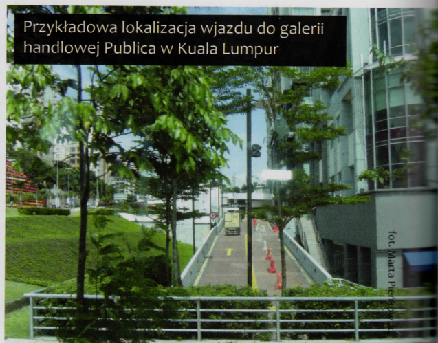
Przykładowa lokalizacja wjazdu do galerii handlowej Publica w Kuala Lumpur